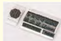
署名捺印プレート