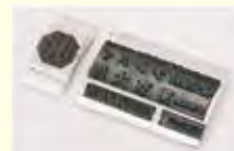
署名捺印プレート